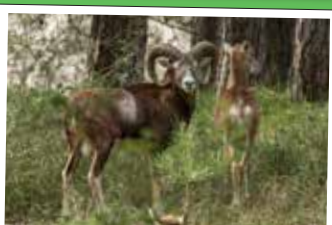
★ Les Mouflons de Corse dans le massif du Marquerterre