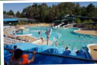
★ Aquacub de Belle Dune à Fort-Mahon Plage