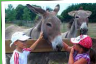
★ L'Asinerie du Marquerterre à Monchaux