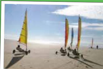
★ Les Chars à voile sur Fort-Mahon Plage et Quend-Plage