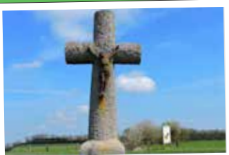
★ Le calvaire en granit de Routhiauville