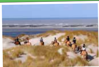
★ Balade à dos de Henson à la Pointe de Saint-Quentin-en-Tourmont