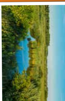
★ Marais de Noyelles-sur-Mer