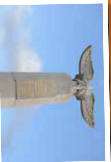
★ Mémorial des Frères Caudron, pionniers de l'aviation à Ponthoile