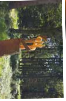
★ La Forêt de Crécy et son festival de sculptures monumentales sur arbres en juin