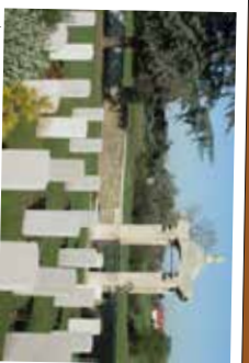
★ Cimetière des travailleurs chinois de la Première Guerre mondiale à Noyelles-sur-Mer