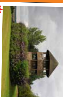
★ Moulin Edouard III, tour d'observation sur le site de la Bataille de Crécy de 1346