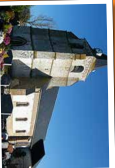
★ Église Saint Martin du XV ème siècle à Forest-Montiers