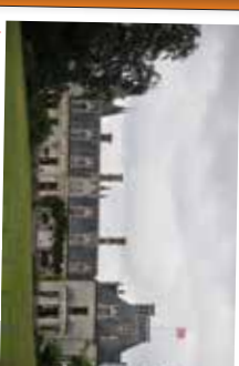
★ Château gothique de Regnière-Écluse