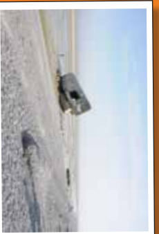
★ Les blockhaus du mur de l'Atlantique entre le Hourdel et Cayeux-sur-Mer