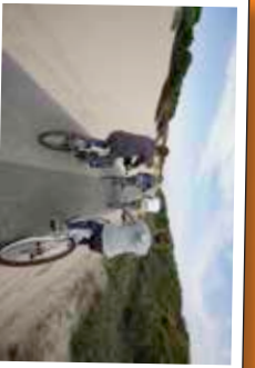
★ La Route Blanche, entre Cayeux-sur-Mer et le Hourdel