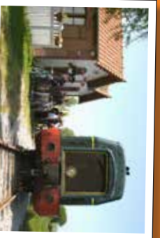
★ La halte du Chemin de Fer de la Baie de Somme à Hurt