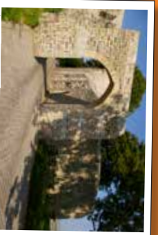
★ La cité médiévale de Saint-Valéry-sur-Somme avec la porte Jeanne d'Arc