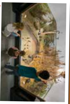
★ La Maison de la Baie de Somme à Lanchères