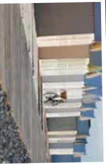
★ Les cabines de plage et le chemin de planches de Cayeux-sur-Mer