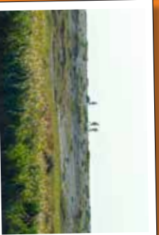
★ La Réserve ornithologique du Hable d'Ault