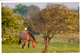
★ Le Henson , le cheval de la Baie de Somme