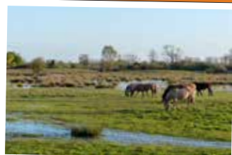
★ Le marais de Larronville, un havre de paix au coeur de la Ville de Rue