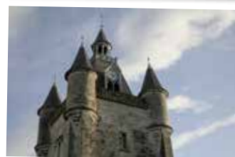
★ Rue et son beffroi, classé Patrimoine mondial de l'Unesco