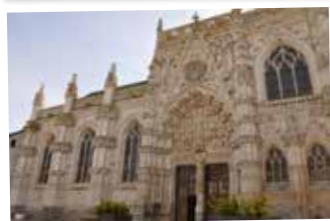
★ La chapelle du Saint Esprit de Rue et son style gothique flamboyant