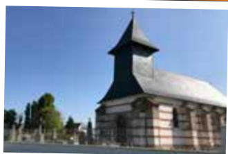
★ L'église de la fin du XVIII ème siècle de Saint-Quentin-en-Tourmont