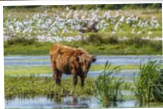
★ Le marais de la Bassée au Crotoy