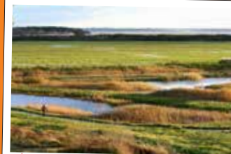
★ Le Parc du Marquenterre , sorties nature et espace préservé